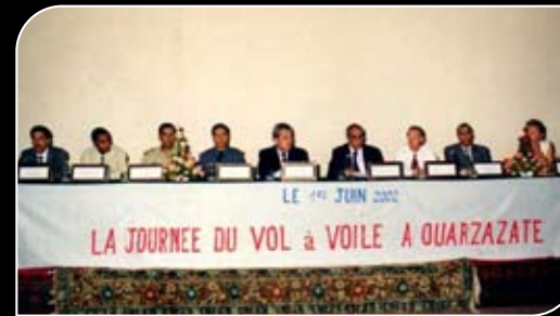
Inauguration officielle du Club de Ouarzazate en Juin 2002