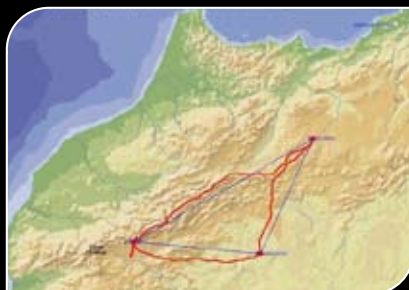
Enregistrement d'un record réalisé en 2004

Faire du grand sud Marocain, la référence mondiale de la pratique du planeur, le moyen de déplacement dans les airs le plus écologique des temps modernes.