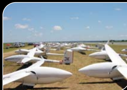
Une compétition internationale